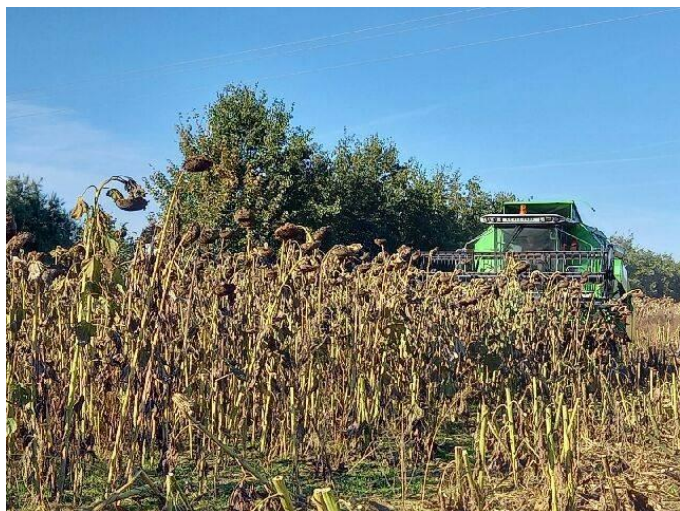
Tournesol bio à Bayonvillers(80)

En végétation, les deux cultures se comportent assez différemment, surtout en termes de salissement. Le soja nécessite des binages réguliers et couvrent globalement de façon assez moyenne. Le tournesol a l'inverse, développe une biomasse très importante qui permet une couverture du sol satisfaisante.