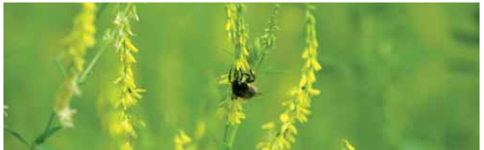
Bourdon sur Mélilot

Parmi les couverts, certains peuvent être ciblés plus particulièrement vers certains groupes d'espèces. C'est le cas des couverts dits « pollinisateurs » qui regroupent les couverts à intérêt apicole et mellifère. Ils ont pour objectif de fournir, aux abeilles domestiques et aux autres pollinisateurs sauvages, des ressources alimentaires, sous forme de pollen et de nectar aux périodes les plus critiques, c'est-à-dire en dehors des périodes de floraison de la flore sauvage.