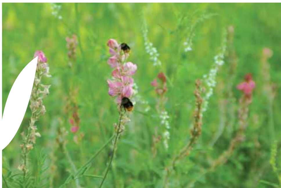
Bourdons sur sainfoin