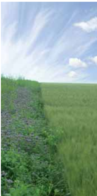
Phacélie en bord de champs

Les mélanges de plantes les plus utilisés (de 20 à 30 kg/ha), disponibles chez les sociétés semencières, associent le plus souvent la phacélie à un socle de trois ou quatre légumineuses (sainfoin, mélilot, minette, lotier corniculé, trèfle violet, trèfle blanc, trèfle hybride, trèfle de Perse). Cette association d'espèces pluriannuelles, au développement plutôt lent, avec une espèce annuelle, au développement plus rapide, assure une couverture dense du sol et une bonne concurrence vis-à-vis des mauvaises herbes. Sur des sols maigres, sans adventices problématiques, la densité du semis peut être diminuée. Le même couvert doit pouvoir être conservé au moins 3 ans. Par ailleurs, certaines espèces, comme la phacélie, les luzernes annuelles ou la moutarde, ont un pouvoir de resemis spontané élevé qui permet de prolonger le couvert à moindre coût dans une jachère fixe. En contrepartie, s'observent des problèmes de repousses en jachère rotationnelle. Dans des rotations céréalières, ces repousses seront plus facilement maîtrisées.