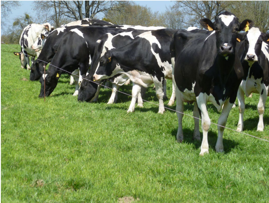
Pâturage au fil