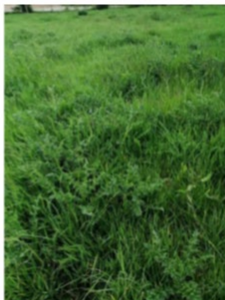
Chardon des champs

Nous cumulon toujours un retard dans la somme des températures depuis le 1 er février :