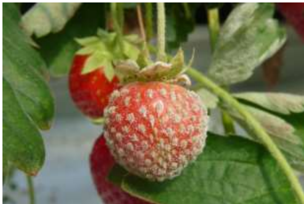
Oïdium sur fruit

Les conditions climatiques étant réunies, il faut maintenir une vigilance pour détecter les premières taches et aérer les structures, sans pour autant créer de courants d'air.