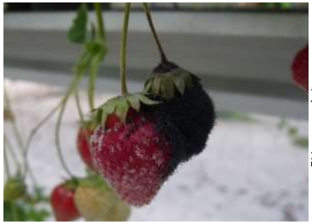
Rhizopus sur fruits

Les fruits atteints doivent être retirés des parcelles pour éviter qu'ils ne contaminent les autres.