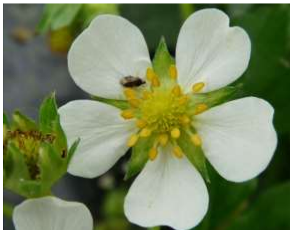
Orius adulte sur fleur

Des acariens prédateurs sont également observés dans plusieurs parcelles, principalement dans des serres avec lâchers d'auxiliaires, mais également dans quelques unes sans lâcher. Par ailleurs, des thrips prédateurs (aeolothrips) sont présents dans certaines parcelles, et on commence aussi à observer des punaises prédatrices adultes dans quelques parcelles (Orius).