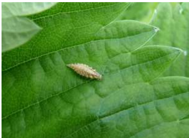
Larve de chrysope

Sous abri, les conditions climatiques chaudes sont favorables au développement de ce ravageur.