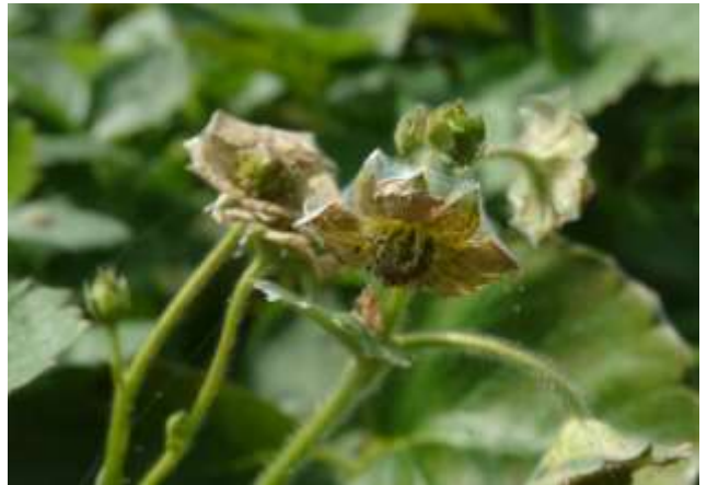
Toiles d'acariens tétranyques tisserands sur feuilles (Cécile BENOIST – CA 59/62)

La gestion de la fraiseraie vis-à-vis de ce bioagresseur passe par la mise en place de mesures prophylactiques. Pour limiter la constitution de réservoirs, le maintien d'un environnement propre et exempt d'adventices, l'entretien de la culture, ainsi que l'élimination des débris végétaux dans les allées sont essentiels.