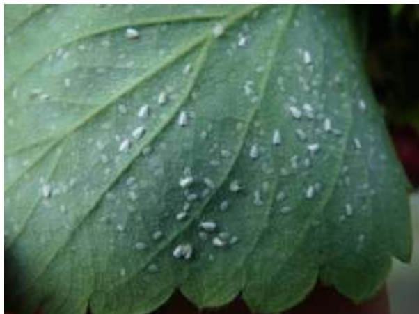
Aleurodes (tous stades) sur la face inférieure d'une feuille

Sous abri, les conditions climatiques sont favorables au développement de ce ravageur. Généralement, les populations ne sont pas un problème en pleine terre. En revanche, en hors-sol, elles sont à surveiller de près, car elles ont tendance à augmenter d'année en année.