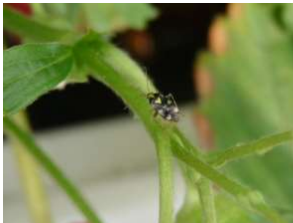
Punaise adulte (Cécile BENOIST – CA 59/62)