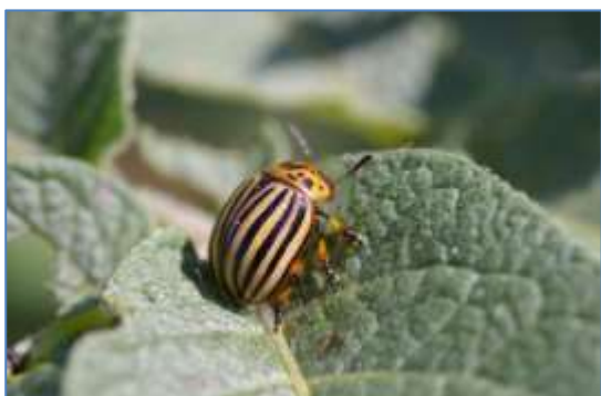
Doryphore adulte