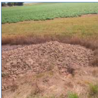
Tas de déchets défané (Contoir Hamel)

✓ Soyez attentif aux zones sensibles telles que bordures de champ, fourrières, démarrages de rampes, courts tours, croisements de rampe, poteaux....,