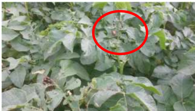
Larve doryphore

Leur présence est observée sur 3 parcelles du réseau (18 observées cette semaine).