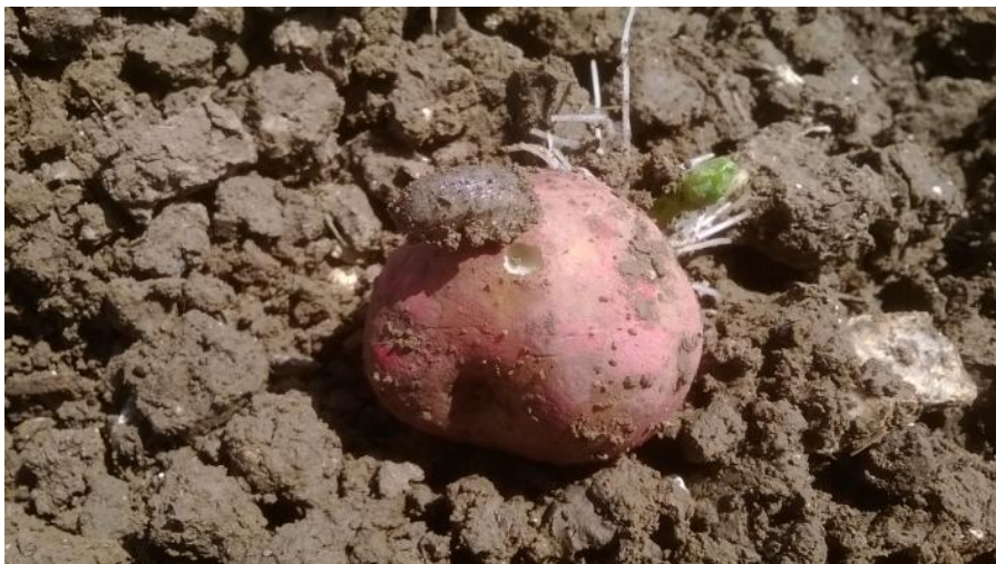
Limace attaquant le tubercule mère, variété Kardal

Sur la parcelle de Kardal à Gezaincourt, la présence de limaces a été signalée (cf Photo Ci-dessous) .