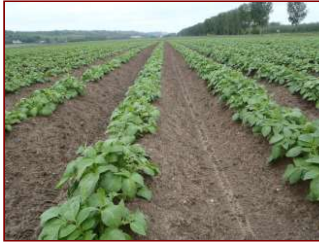
Pommes de terre plantées mi avril Variété Hinga ( Féculerie de Vic Sur Aisne )

Les levées de pommes de terre en parcelle se poursuivent timidement.