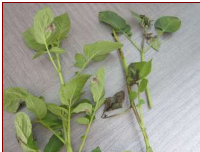
Symptômes de mildiou sur folioles et tiges (Coopérative féculière de Vecquemont)

Les premiers symptômes de mildiou, sur folioles et tiges sont observés sur le tas de déchets de Blangy Tronville (80).