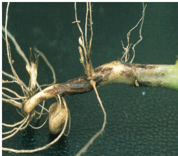
Attaque sur tige

Incidences : manque à la levée, perte de rendement et dépréciation des tubercules.