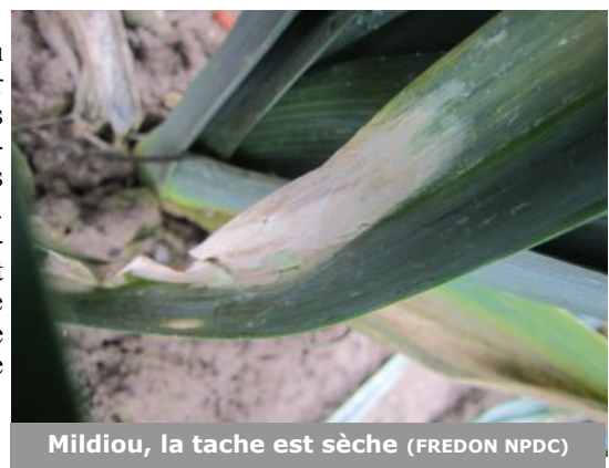
Mildiou, la tache est sèche

Des traces de mildiou sèches sont observées sur 4% des plantes de l'une des parcelles observées à Allouagne (62) et sur 8% des poireaux à Violaines (62). Pour l'instant les symptômes ne se développent pas. Attention tout de même car l'alternance de gel et de dégel est favorable à la maladie.