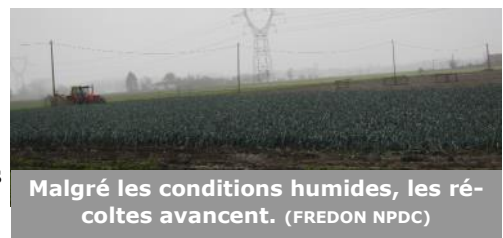
Malgré les conditions humides, les récoltes avancent.

Les températures annoncées pour les prochains jours sont comprises entre -2 et 6°C. Quelques pluies éparpillées sont aussi annoncées.