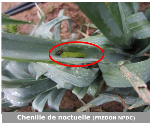
Chenille de noctuelle (FREDON NPDC)

Une chenille de noctuelle a été observée à Emmerin (59)