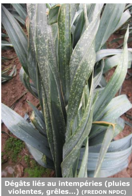
Dégâts liés aux intempéries (pluies violentes, grêles...) (FREDON NPDC)