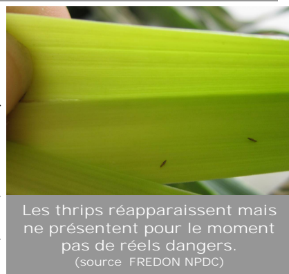
Les thrips réapparaissent mais ne présentent pour le moment pas de réels dangers.

Sur certaines parcelles, des thrips ont été observés sur les poireaux. Les après-midi chauds comme celui de lundi sont en effet propices à leur retour sur le feuillage. Pour autant, les journées restent fraîches et il n'y a a priori pas d'inquiétude à avoir pour les poireaux encore en terre.