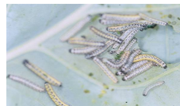
Larves de piérides du chou (FREDON NPDC)