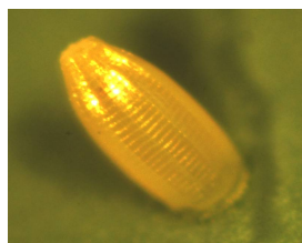
Œuf de piéride de la rave

Les larves de piéride du chou sont visibles très souvent en groupe de 4 à 5 individus, voire plus si les œufs viennent d'éclore.