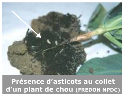
Présence d'asticots au collet d'un plant de chou

La présence d'asticots aux pieds des choux est aussi observée sur d'autres parcelles notamment sur le secteur de St Omer.