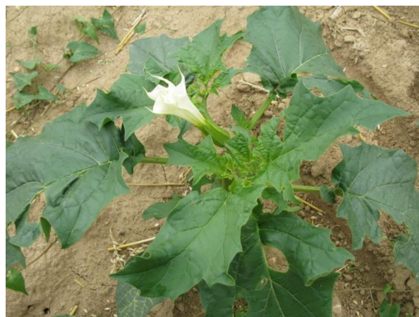
De gauche à droite : Datura au stade 6 feuilles & Datura au stade floraison