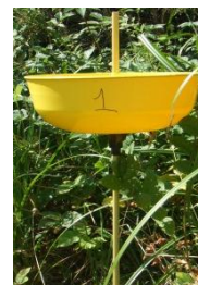
Piégeage par Cuvette jaune

Les auxiliaires suivis sont : les coccinelles , les sympes , les chrysopes , les carabes et les hyménoptères parasitoïdes . Ces observations s'effectueront par piégeage (cuvette jaune) et par comptage/observations visuelles à partir d'avril. Les sites observés seront des jardins (bandes enherbées et haies), des espaces verts et des parcs (parterres, haies, pelouses, etc.), des éléments paysagers en bords de champs et des parcelles agricoles.