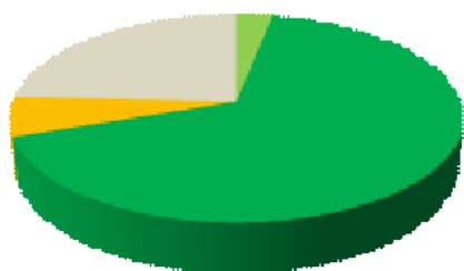
Rubrique « Actualités en Région »