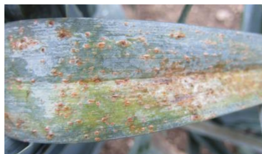
Rouille sur poireau (FREDON HdF)