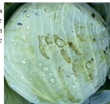
Dégâts de limaces sur chou (Natur'Coop)

Des limaces et leurs dégâts sont observés sur des choux en bordure de parcelle dans le secteur Audomarois (62). Leurs morsures peuvent toucher plusieurs couches de feuilles. Avec les températures plus douces, elles attaquent les choux aussi bien en journée que la nuit. Les limaces se cachent au pied du chou. Elle continue de se nourrir sur les choux stockés en hangar. Restez vigilants !