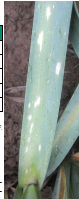
Symptômes de stemphyliose sur poireau