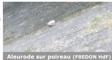
Aleurode sur poireau

Sur les parcelles du réseau situées à Ennetières-en-Weppes (59), Loos-en-Gohelle (62), Herlin-le-Sec (62), Allouagne (62) et Violaines (62), des aleurodes sont constatées sur quelques poireaux. Aucune ponte ni dégât n'ont été recensés. Cet insecte n'est pas connu pour être un nuisible sur cette culture.