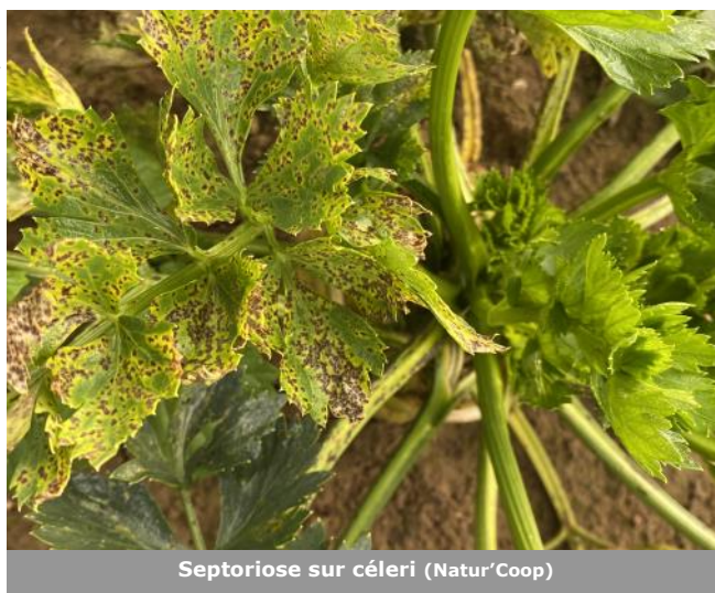
Septoriose sur céleri (Natur'Coop)

Lors de l'arrachage cela peut poser problème car les feuilles sont affaiblies.