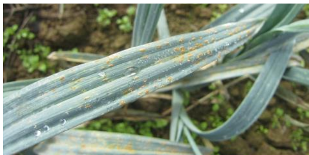
Rouille sur poireau (FREDON HdF)