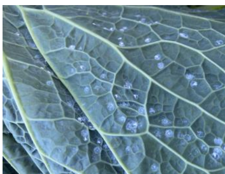
Aleurodes sur chou frisé (Natur'Coop)

Les aleurodes se cachent parfois sur la face inférieure des feuilles. Ce sont surtout les dégâts indirects qui sont préjudiciables pour la culture : la fumagine (maladie provoquée par des moisissures noires dues à des champignons) se développe grâce au miellat sécrété par les insectes piqueurs-suceurs. Attention à ne pas se laisser envahir car ces insectes se multiplient très rapidement. La pression est encore importante cette semaine, les conditions météorologiques actuelles (températures inférieures à 20°C, pluie) limitent leur multiplication. Surveillez vos parcelles !