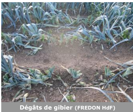
Dégâts de gibier (FREDON HdF)