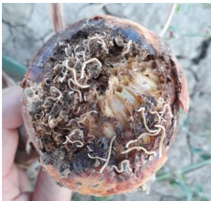
Dégâts et présence de blaniule (PLRN)