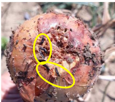
Pupes de mouche de l'oignon (PLRN)

À Richebourg (62), quelques plantes contaminées par le mildiou sont observées. À Haisnes (62), plusieurs foyers de mildiou ont été constatés. A ce stade de la culture, le mildiou n'est plus préjudiciable aux oignons, de plus les taches sont séchées avec les conditions chaudes et sèches actuelles.