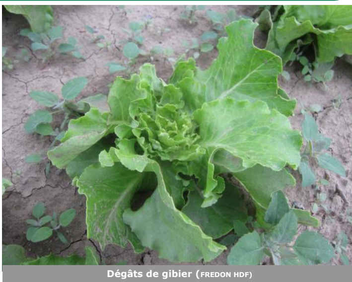
Dégâts de gibier

en compte. Bien que l'efficacité de ces mesures semble limitée, leur mise en place permet de réduire les dégâts. Afin d'augmenter l'efficacité de ces techniques, il est nécessaire de les combiner et de les alterner. Ces systèmes ne permettent pas d'éliminer les nuisibles, il est possible de contrôler les populations en les régulant. En ce qui concerne les nuisibles (la liste est différente pour chaque territoire), les documents nécessaires à leur régulation sont disponibles auprès des Fédérations de Chasse de chaque département. Les Fédérations de Chasse pourront ainsi vous renseigner sur les dates d'ouverture et de fermeture de la chasse, sur la liste des espèces classées nuisibles dans votre commune, sur les formulaires de demande de destruction et les autorisations à tir... Elles pourront également vous fournir les informations concernant l'indemnisation des dégâts causés par le grand gibier (sanglier, chevreuil, cerf...) sur les cultures et récoltes agricoles