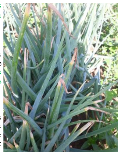
Botrytis squamosa (PLRN)

À Courcelles-le-Comte (62), un foyer de Botrytis squamosa est observé. Les conditions sèches annoncées pour les prochains jours ne seront pas favorables au développement de la maladie.