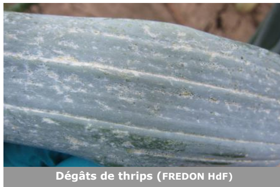
Dégâts de thrips

Lorgies (62), 10% des pieds sont touchés avec 1 à 3 thrips par pied. Des aeolothrips (auxiliaires) sont également présents. Le seuil indicatif de risque n'est pas atteint, surveillez bien les parcelles, pour rappel le seuil d'intervention est de 2,2 thrips par feuille , les conditions climatiques annoncées seront favorables au développement de la culture mais au vu du stade des cultures, le risque est faible.