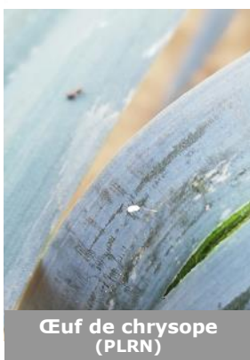
Œuf de chrysope (PLRN)