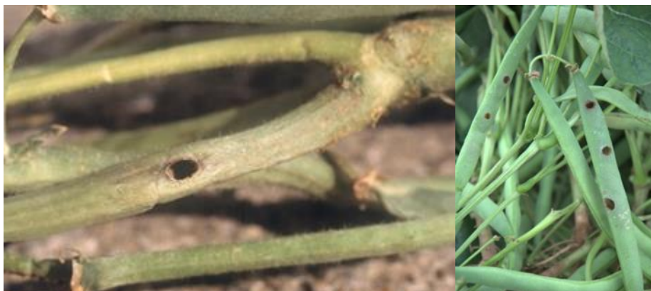
Galleries de chenilles de pyrale sur tige et gousses de haricots (UNILET)

La pression « Héliothis » augmente, principalement dans le Santerre avec des captures allant de 3 à 19 papillons en une semaine entre Estrées-Denicourt et Biarre. Pour les autres secteurs (Aisne, Mesnil-aux-Bois, Bapaume, Vexin) on est environ à 1 capture en 1 semaine. Pour rappel, le piégeage fournit une information sur l'activité et les vols de ces papillons mais il n'y a pas de corrélation entre le niveau de capture et les dégâts potentiels. L'observation des parcelles est indispensable pour évaluer le risque et doit être renforcée à partir de la floraison : recherche de plaques de pontes de pyrales sur la face inférieure des feuilles, de chenilles, de trous dans les tiges et les gousses. Les pyrales peuvent coloniser les cultures de haricots à partir du stade 3-4 feuilles trifoliées mais c'est surtout au moment du grossissement des gousses que les risques d'attaques augmentent. Les flageolets et les haricots beurre sont particulièrement attractifs. Le développement des pyrales est favorisé par un temps chaud, humide et sans vent. Les précédents maïs à proximité des parcelles de haricots constituent un facteur de risque supplémentaire.