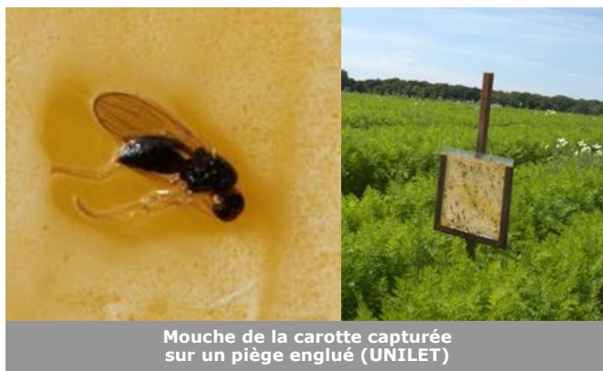
Mouche de la carotte capturée sur un piège englué

Aucune capture de mouche de la carotte n'est enregistrée cette semaine hormis à Bucquoy (62) où une seule mouche a été capturée. Les températures de cette semaine devraient encore limiter l'activité des adultes (diapause estivale). La sécheresse est très défavorable à la survie des pontes qui pourraient avoir lieu.