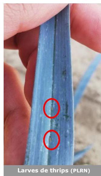
Larves de thrips (PLRN)