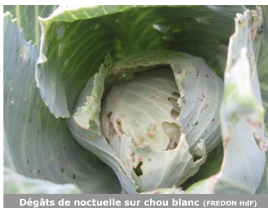
Dégâts de noctuelle sur chou blanc (FREDON HdF)

A Illies (59), des aleurodes ont été observés sur la totalité des plants avec au moins 20 individus par plant. A Ennetières-en-Weppes (59), on observe également quelques aleurodes sur 36% des pieds de choux cabus. A Saint-Momelin (59), 16% des choux fleurs sont porteurs d'aleurodes. Les aleurodes sont désormais bien présents sur toutes les parcelles et pondent généralement sur la face inférieure des feuilles. Les températures comprises entre 15 et 27°C et les conditions ensoleillées prévues pour les prochains jours vont être favorables au développement de ce ravageur.