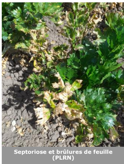
Septoriose et brûlures de feuille (PLRN)